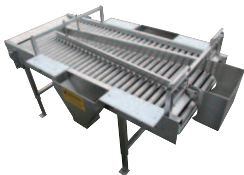
Rolkowy stół selekcyjny z lejami selekcyjnymi, listwami rozdzielczymi i półkami do rozcinania produktów

Rolkowy stół selekcyjny nadaje się do wszystkich rodzajów warzyw korzeniowych i bulwiastych. W przypadku podłużnych produktów, np. marchwi, ważne jest, aby plony były podawane poprzecznie na rodkowy stół selekcyjny. Do przebiegania takich produktów można zastosować alternatywnie taśmy selekcyjne produkowane również przez firmę Schneider.